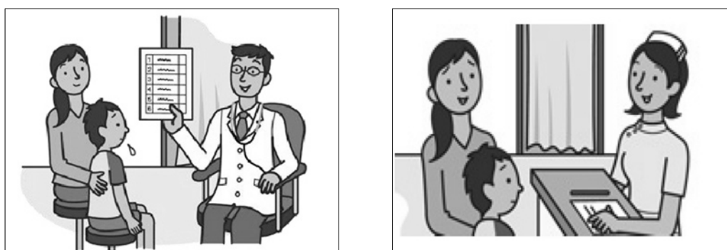
図4 受診対応プログラムの一場面