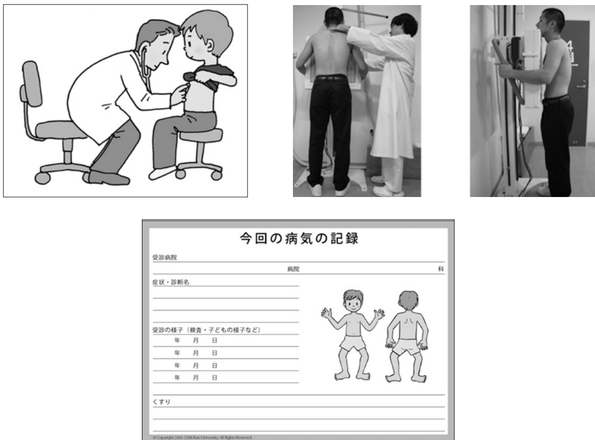
図3 受診サポートカードの例