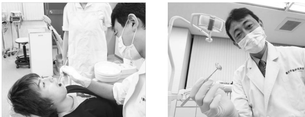
図2 歯科受診プログラムの一場面