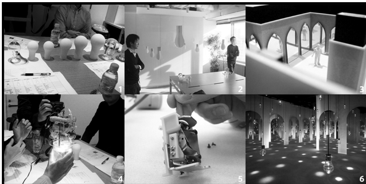
図2 OVERTURE のプロトタイプ

タの動作検討を行うために製作された。水を介して人間の手の近接を検知するセンサーシステムの実装検討が行われた。